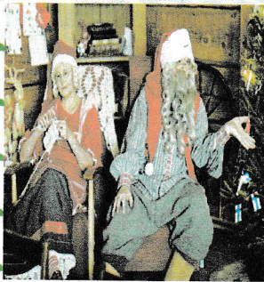
его жена Муори.

В Финляндии вместо Деда Мороза подарками одаривает детей рождественский козел, который приходит на праздник в красной лохматой шубе и с волшебной книгой, где записаны все детские проказы и шалости?